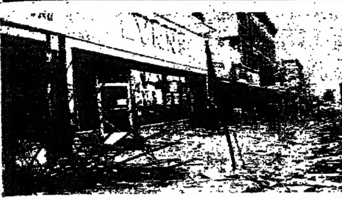
الركام أمام بعض المحلات التي نهبت في نيويورك أثناء انقطاع التيار الكهربائي .

ظلام نيويورك - تتمة معمل نووي للطاقة في شمال نيويورك على امتداد الأن ، مما أدى الى انقطاع التيار الكهربائي . وبقيت اقسام عديدة من نيويورك التي هي أكبر مدن الولايات المتحدة ، ويبلغ عدد سكانها ثمانية ملايين نسمة ، عالةً لأنها في ذاتها أكبر انقطاع في التيار الكهربائي تشهد المدينة منذ سنة . وقام شبان ويحملون مشاعل يتساعده البرابسي في معالجة عرقلة التيار . الحرق لا ان السكان في منطقة بروكلين القفيرة وفي بروكلين يعانون تماماً من نهب المتاجر بشكل مطلق ، واخذ عدد منهم يشتعلون بميات الحرائق . واعلان ابراهيم بيبي رئيس بلدية نيويورك حالة طوارئ بعد ورود اتباء عن عمليات نهب لحالات غير مسبوقة الحراسه . وعاد التيار الكهربائي الى جزء كبير من المدينة بعد ظهر أمس ، ولكنه بعد مرور اكثر من 12 ساعة على انقطاعه . وكان التيار الكهربائي قد انقطع في ايامه السابقة والحقبة الماضية . والآن من شأنه ان يوقف حركة المدينة كما على السكان من ارتداء ثياب الحراة والرطوبة . في الشوارع وقالت وكالة الصحافة الفرنسية : ان احد السدود في منطقة «بروكلي» قولها : انها ليلة الحيوات الا قد كانت بعض الشوارع الرئيسية التي تربط احياء منطقة الحرب ، وقد انزلت واجهات المحلات على اعدادات بلسات الاثار وتآثر حطام الزجاج على الارضه . وقد لاحظ احد السدود رجال البوليس باستغراب ان الصومع يتنمون الى اقسام مختلف الامارات ومختلف الكليات الضامه . بل ان الايام التي كانوا يستكثرون تصرفات ابلتقد قد شاهدتهم أمس الاول على خلاف العادة . نيويورك - ر. و.ص.ف.